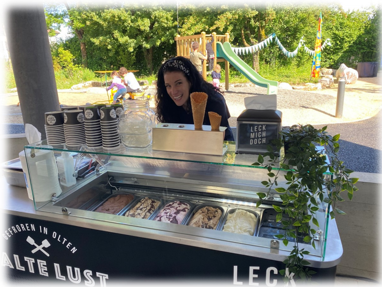
Für eine kleine Abkühlung ist mit der „kalten Lust“ selbstverständlich gesorgt.