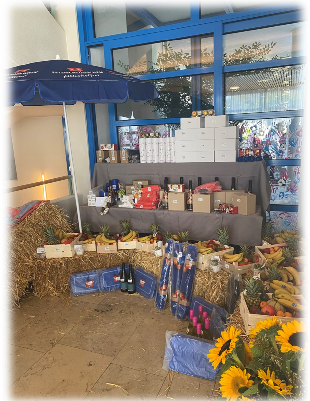
Die Tombola fand grossen Anklang.