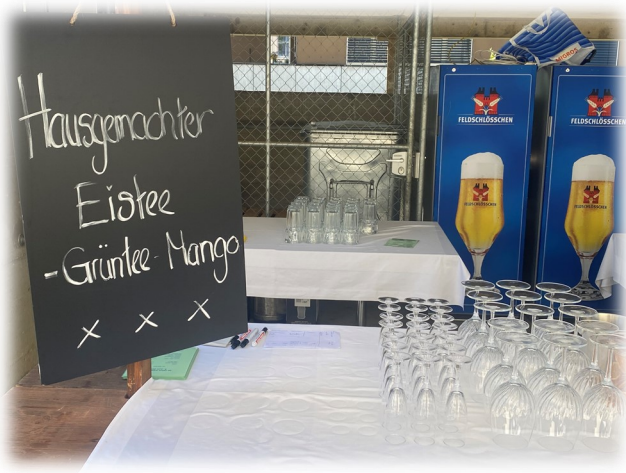
Kommt der Durst, darf der hausgemachte Eistee nicht fehlen.